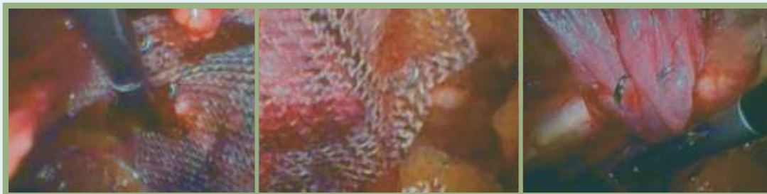
Pictures of SPIRE'IT® sutures implanted on during TEP procedure for direct bilateral inguinal hernia repair in mesh fixation and tissues approximation.

Images de sutures SPIRE'IT® implantées pour la fixation d'implant et de tissus dans une cure de hernie inguinale directe bilatérale par voie TEP.